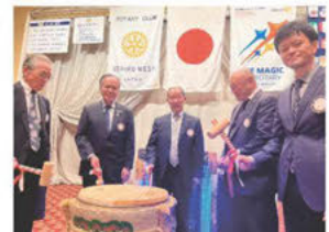
飯田会長、森会長エレクト、年男3名による鏡開き